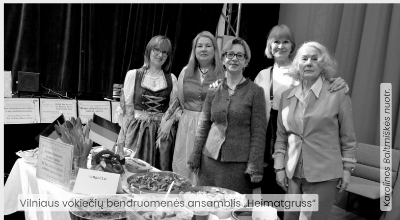
Vilniaus vokiečių bendruomenės ansamblis „Heimatgruss“