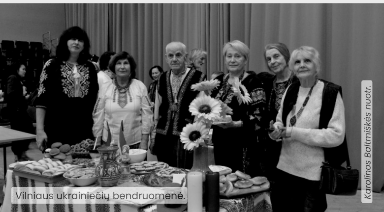
Vilniaus ukrainiečių bendruomenė.