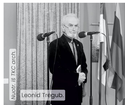
Nuotr. iš TKC arch. Leonid Tregub.