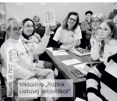
Viktorina „Pažink Lietuvą lietuviškai“

◆ Klaipėdos tautinių kultūrų centras (TKC) atsiliepė į Valstybinės lietuvių kalbos komisijos kvietimą švęsti lietuvių kalbos dienas ir rengti kalbai skirtus renginius. Šiomet surengta viktorina „Pažink Lietuvą lietuviškai“. Anksčiau vyko renginys lietuviškai kalbėti subūręs Klaipėdos tautinių bendruomenių sekmdieninių mokyklų vaikus. Lietuvių kalbos TKC mokosi beveik 100 žmonių. Valstybinės kalbos mokymus finansuoja Tautinių mažumų departamentas prie LR Vyriausybės ir Valstybinė lietuvių kalbos komisija.