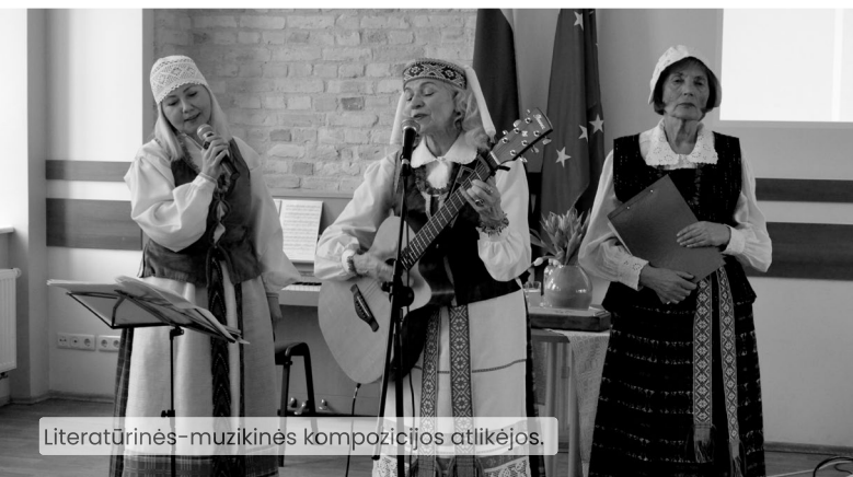
Literatūrinės-muzikinės kompozicijos atlikėjos.

Šiomet minime lietuvių poeto, elegijos žanro pradininko lietuvių lyrikoje Prano Vaičiaičio 150-ąsias gimimo ir 125-ąsias mirties metines. Seimas, atsižvelgdamas į istorinės, politinės, sociokultūrinės atminties išsaugojimo svarbą ir valstybei svarbių įvykių, asmenybių, sukakčių atmintinus minėjimus, priėmė rezoliuciją, kuria pakvietė 2026 metais prisiminti Praną Vaičiaitį.