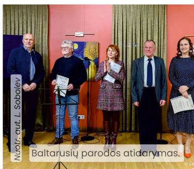
Baltarusių parodos atidarymas.