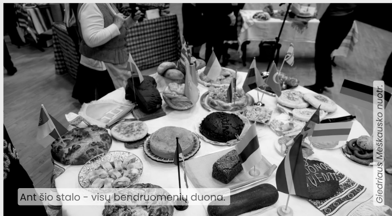
Ant šio stalo – visų bendruomenių duona.