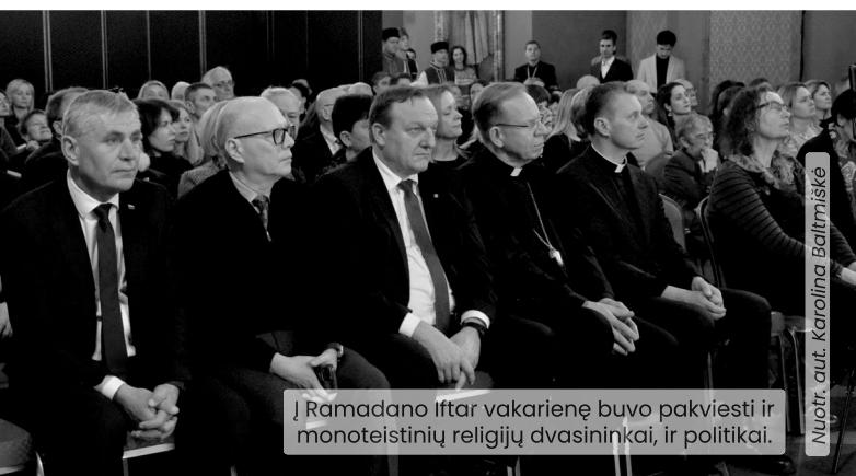
Į Ramadano Iftar vakarienę buvo pakviesti ir monoteistinių religijų dvasininkai, ir politikai.