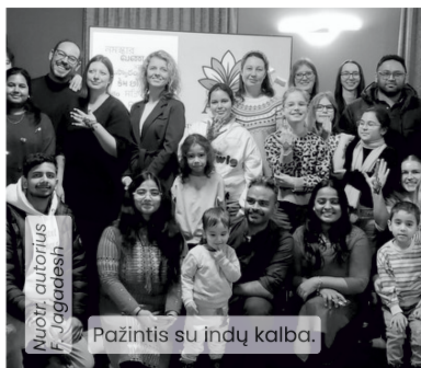
Pažintis su indų kalba.