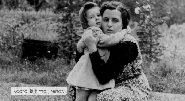
Kadrai iš filmo „Irena“.