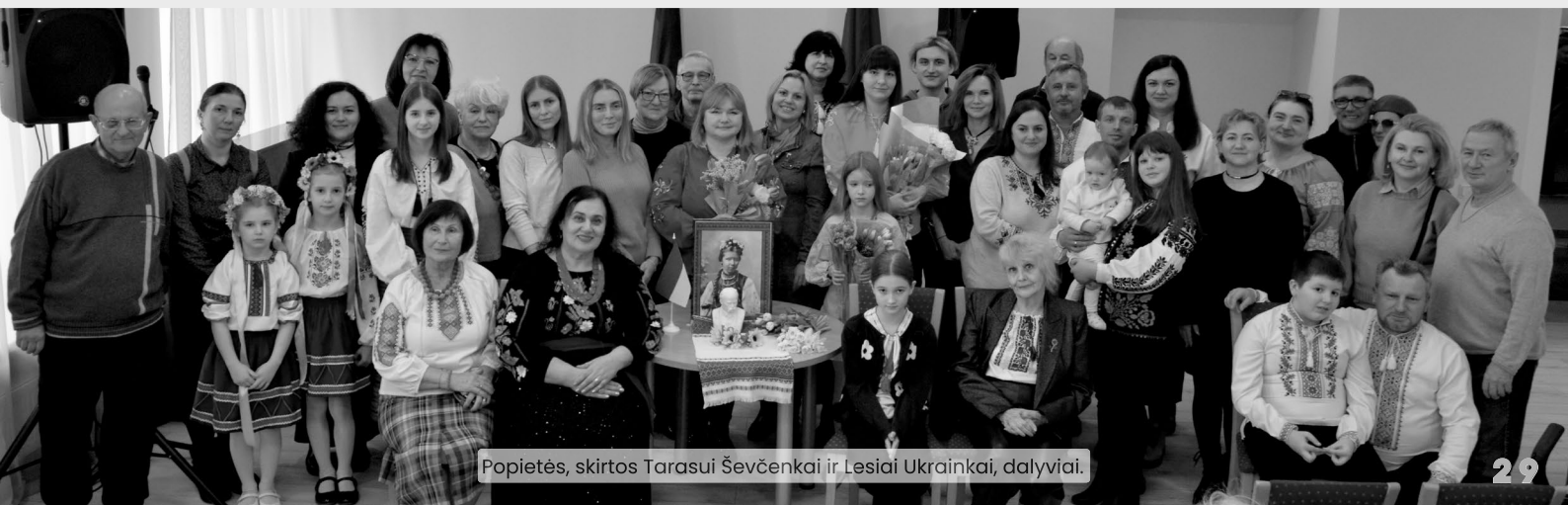
Popietės, skirtos Tarasui Ševčenkai ir Lesiai Ukrainkai, dalyviai.

Parengta pagal Vilniaus ukrainiečių bendrijos inf.