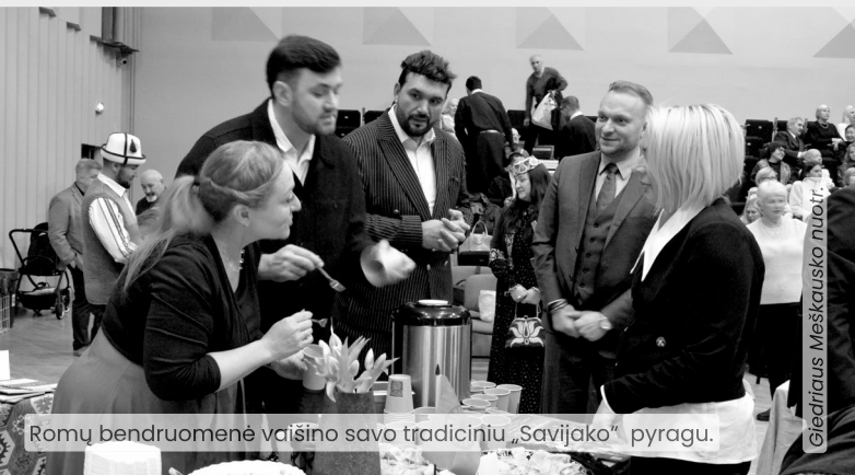
Romų bendruomenė vaišino savo tradiciniu „Savijako“ pyragu.