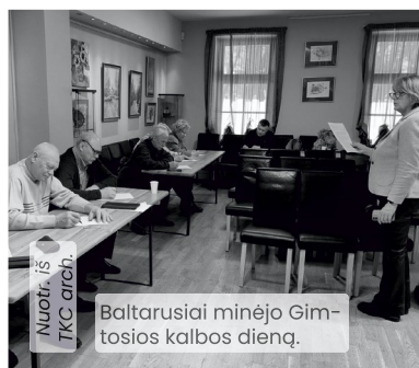
Baltarusiai minėjo Gimtosios kalbos dieną.