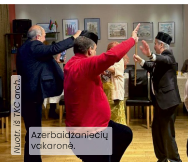
Azerbaidžaniečių vakaronė.