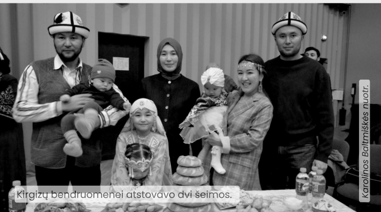
Kirgizų bendruomenei atstovavo dvi šeimos.