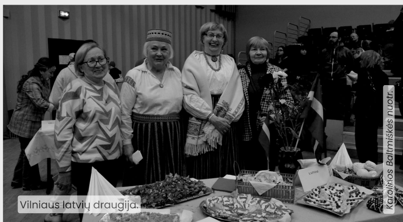
Vilniaus latvių draugija.

„Mano manymu geriausiai duoną apibūdina baltarusių poetės Larysos Henijuš žodžiai: „Su duona ir