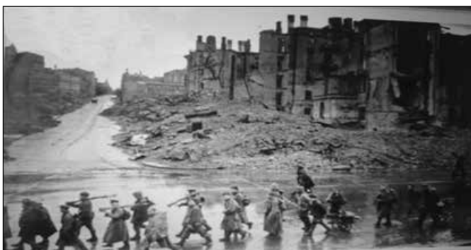
Raudonosios armijos kariai žygiuoja Alytaus miesto sugriautomis gatvėmis

Taip sutapo, kad XX a. 4–5 dešimtmetyje kaime susikūrė daug jaunų šeimų ir kaimas pasipildė jaunomis šeiminkėmis, vadinamomis marčiomis. Jas, kaip įprasta, vadindavo pagal vyrų vardus ar pravardes: Adomienė-Adiukienė, Šimienė-Samunienė, Tamošienė, Lioskienė, Chasenkienė, Kūbienė, Jonienė-Vankienė ir pan. Kai kurių moteriškių nuotraukos žemiau.