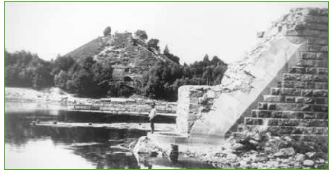
Alytaus Antano Juozapavičiaus vardo tilto griuvėsiai po karo

Mūsų kartai, gimusiai Antrojo pasaulinio karo išvakarėse ir karo metu, apie karus priminė vyresniųjų netektys, jų išgyvenimai ir pasakojimai apie karus. Mes prisimename tik Antrojo pasaulinio karo atskirus epizodus. Nuotrauka žemiau. Matėme per kaimą pravažiuojančią vokiečių karių techniką, o po kažkiek laiko pražygiavo ir Raudonosios armijos ginkluoti kariai su kitokia technika, apranga, kalba ir kitais skiriamaisiais ženklais. Girdėjome sviedinių sprogimų aidus tai iš Kauno, tai nuo Alytaus ar Varėnos pusių ir dar nežinia iš kur. Laikui bėgant bombų sprogimo dundesys ir gaisrų pašvaistės pradėjo retėti. Visi džiaugėsi, kad jau baigėsi karas. Bet žinios kaimą pasiekdavo prieštaringos – karo veiksmai dar tęsėsi tik persikėlė toliau į kitus kraštus. Po kurio laiko karo aidai vis tolo, tolo ir nutolo. Liko tik akivaizdūs karo pėdsakai: susprogdinti miestai, tiltai, geležinkelio bėgiai ir magistraliniai keliai. Nuotraukos pateikiamos žemiau. Ilgai po karo buvo atstatomi miestų gyvenamieji namai, infrastruktūra ir užmiesčiuose susprogdinti keliai.