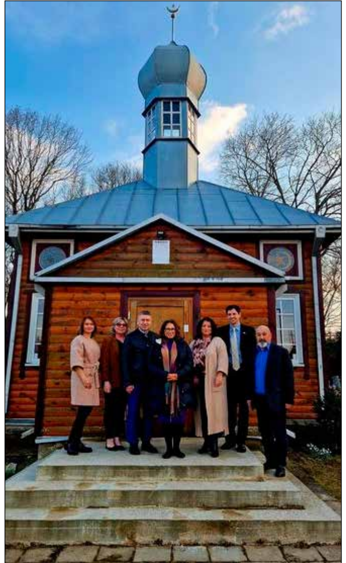
Delegacija sutinkama prie Mečetės Nemėžyje

Tautinių mažumų departamento pasiūlymu po susitikimo tautinių bendrijų namuose JAV Vyriausybės atstovai apsilan-