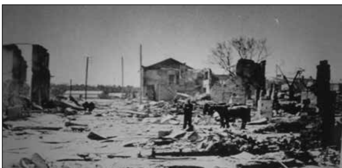
Alytaus miesto sugriauti namai

Kaime jau buvo susiformavusi ir materialiai sutvirtėjusi nauja ūkininkų karta. Vyrų, išlikę sveiki po karo, prisiminė savo pagrindines pareigas – rūpintis šeimomis, pradėjo vėl ūkininkauti. Kai kurie