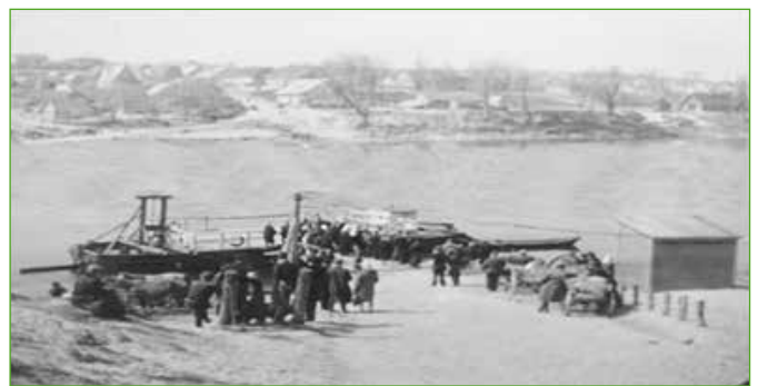
Keltas per Nemuną Alytuje, pokaris