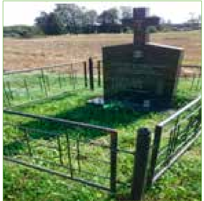
Paminklas Dzūkų rinktinės partizanams, žuvusiems Valiūnų kaime