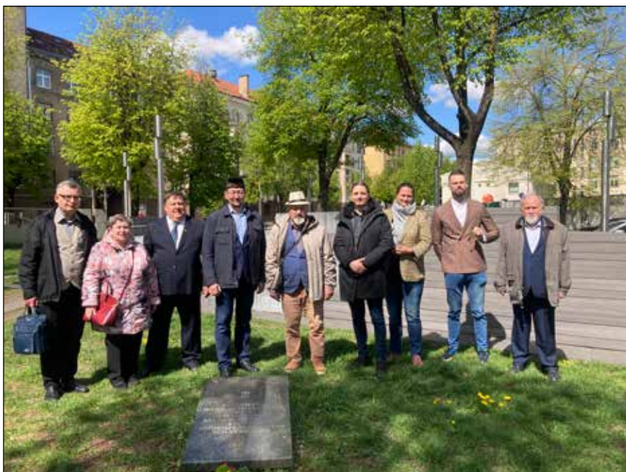
Ceremonijos dalyviai prie paminklinės lentos, žeminčios buvusias Senąsias Kauno totorių kapines