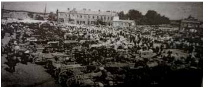
Alytaus turgus miesto centrinėje aikštėje apie 1931–33 m.

Islamo tikėjimo religija Lietuvos totorius vienijo. Gyvendami krikščioniškoje aplinkoje, o sovietmetyje veikiant plačiai ateistinei propagandai, tik dėl bendruomenės uždaro ir savitos is-