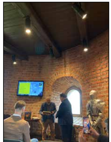
Kauno pilies salėje