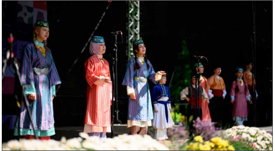
Norime pasidalinti akimirkomis iš koncerto.