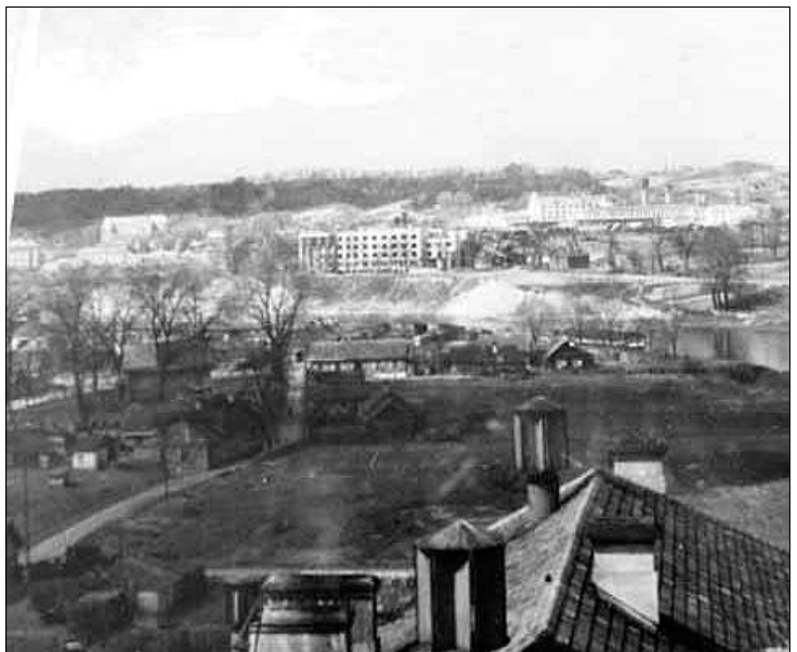
Vaizdas į Lukiškių totorių mečetę ir senųjų kapinių vietą nuo Mokslininkų namų stogo, XX a. 6 deš. nuotrauka.

ko kapinių vaizdas. Galiausiai, gal 1968 m., dabartiniu adresu A. Goštauto 11, pradėtas statyti buvęs Lietuvos MA Pustelaidininkų fizikos institutas. Pradėjus kasti tranšėjas pastato pamatams iš ekskavatoriaus kaušo pradėjo kristi žmonių kaukolės. Statybos kuriam laikui buvo sustabdytos. Po keleto dienų atvežė iš lentų sukaltas dėžes, į kurias krovė iškasamus žmonių kaulus. Baigus kasti dėžes kažkur išvežė. Šio pastato B-korpusas stovi tiksliai ant mečetės vietos, o aplink pastatą buvusią kapinių vietą įrengtos mašinų stovėjimo aikštelės.