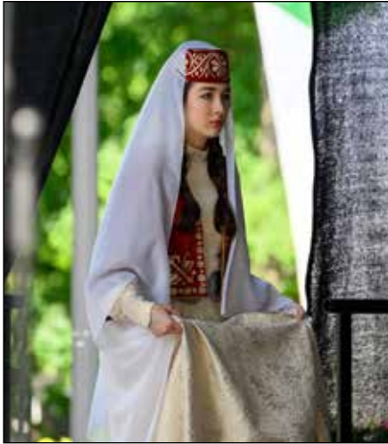
jaunųjų grupę papildė nauji dalyviai, taip pat Krymo totoriai iš užsienio.